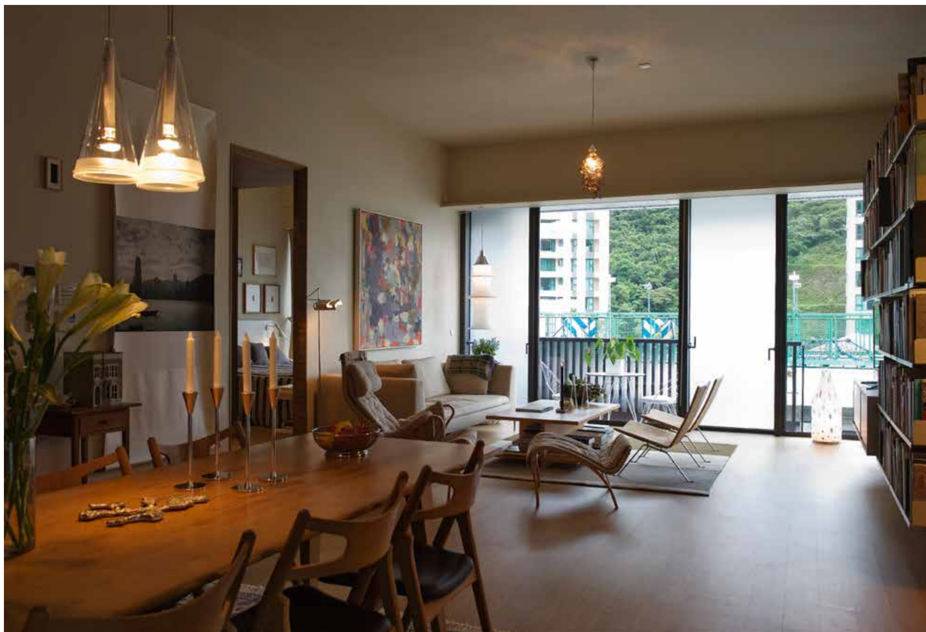
2. BILDRUBRIK 2. Bild kursiv